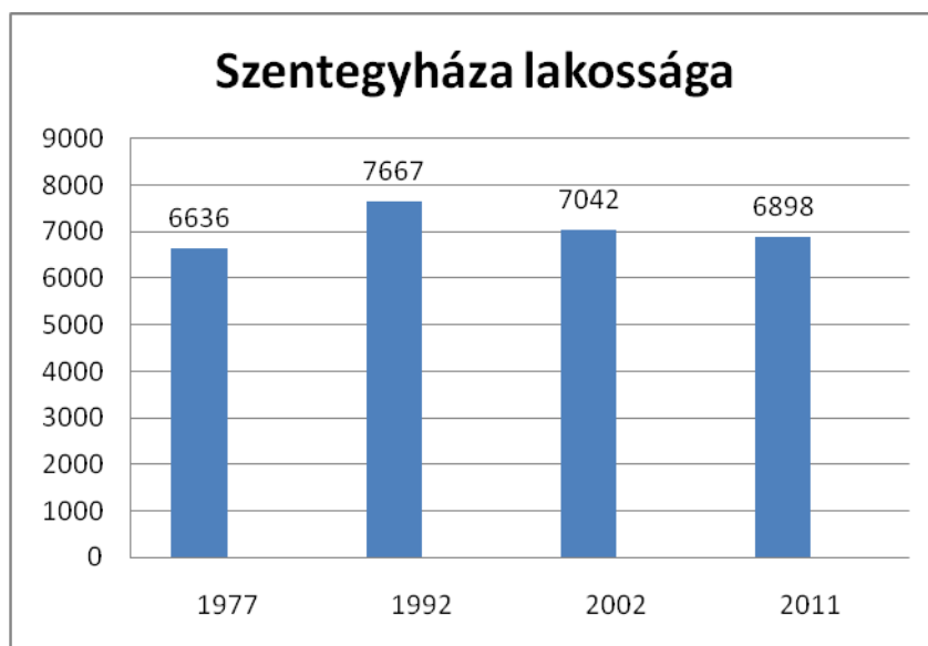
1.Ábra: A lakosság változása,

A demográfiai elemzés a város emberi erőforrásainak elsődleges feltérképezését hivatott elvégezni, feltárva a Szentegyházán zajló népesedési folyamatokat.