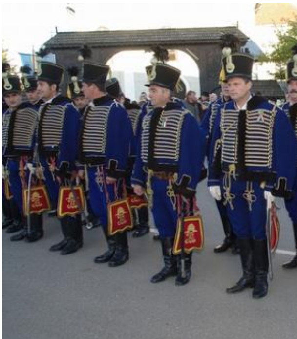
4. Ábra: Huszárruha, Forrás:

2006-ban készítették el huszárruháikat. A huszárruha a székely határőrezred korhűen rekonstruált felszerelése: fekete kemény szárú bőrcsizma, kék nadrág, mente és dolmány, fekete és sárga zsinórdíszítéssel és fekete csákó. A huszárok többsége saját lóval rendelkezik. Minden huszár karddal büszkélkedhet, melyet a sümegi várban ajándékoztak a magyar barátok.