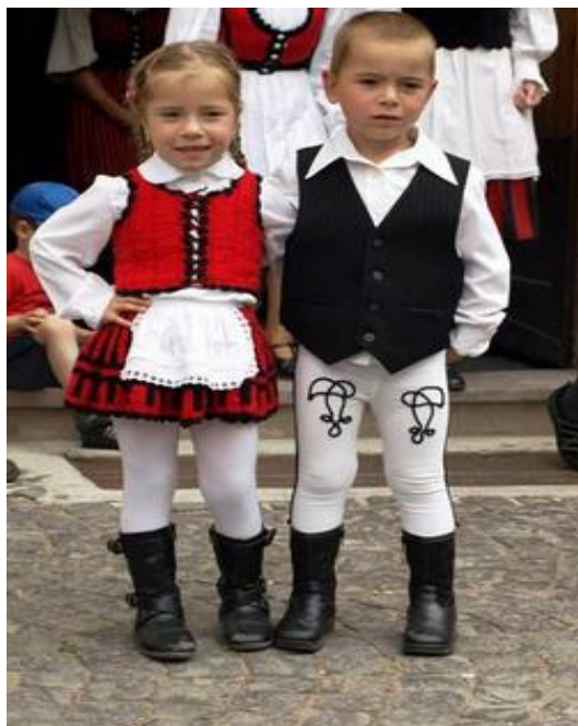
3. Ábra: Népviselet, Forrás:

https://www.google.ro/search?q=szentegyh%C3%A1zi+n%C3%A9pviselet&newwindow