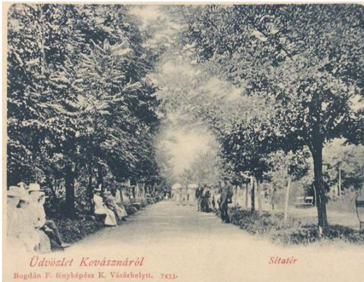
Üdvözlét Kovásznáról Bogdán F. fényképész K. Vásárhelyt. 7433.

A mai ügyes, fejlett világnak köszönhetően, a Facebookon találtam pár hajdani képet, amely kicsit használhatóbb állapotban van, mint a nagyszüleimtől kapott. Ám a színes képek, már saját készítésűek. Próbáltam, egy kis segítséggel beazonosítani, hogy mely mai helyek láthatóak a képeken. Remélem sikerült. Az alábbi képen a mai Művelődési Ház melletti Sétatér látható, mely ma a sportpálya és a játszótér fele vezet.