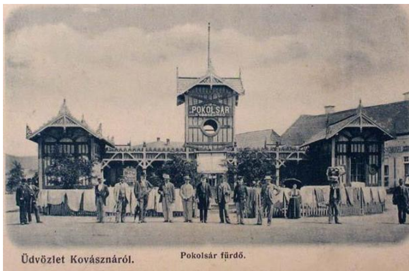
Üdvözlét Kovásznáról. Pokolsár fürdő.

Ezen a képen a Pokolsár Gyógyfürdő látható, mely nem rég épült újra városunk központjában, a sétavonattal előtt helyezkedik el. Ma már helyi tárgyakat, emlékeket lehet