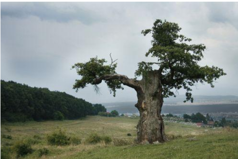
2. kép Az egyfa