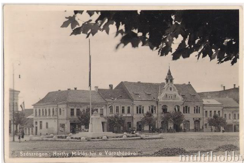
4. kép A városháza régen