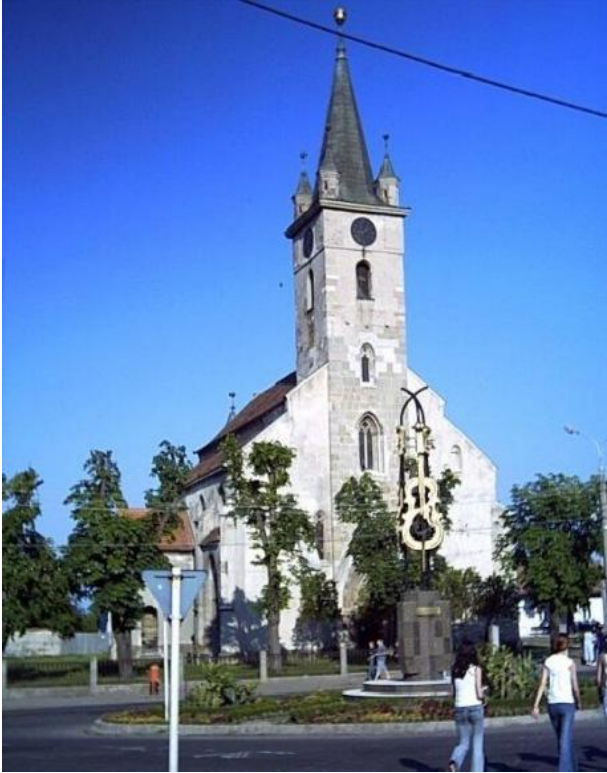
1.kép A szásztemplom az előtte található szoborcsoporttal